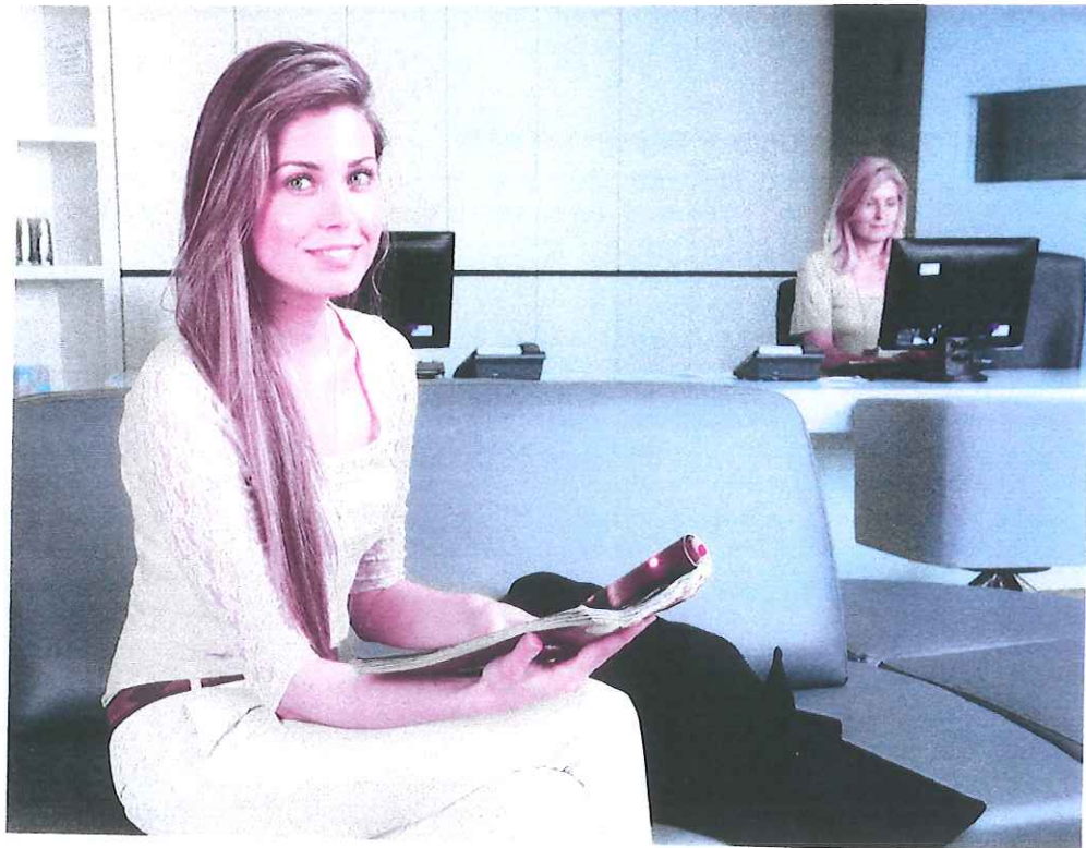
Angenehmes Warten auf einen minimalinvasiven Eingriff dank PRIMEO

Bei einer ambulanten Behandlung im Ausland werden die Kosten im gleichen Umfang wie im Inland übernommen. Voraussetzung ist eine Kostengutsprache durch Helsana.