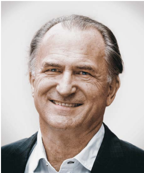
DR. HANSPETER FLURY PRÄSIDENT SLH

Trotz Ende der COVID-Pandemie stehen die Schweizer Spitäler weiterhin unter grossem wirtschaftlichem Druck. Dies einerseits wegen Rohstoffmangel und Teuerung ohne entsprechende Erhöhung der Tarife und andererseits durch massiven Druck auf das Zusatzversicherungssystem seitens der Finanzmarktaufsicht (FINMA).